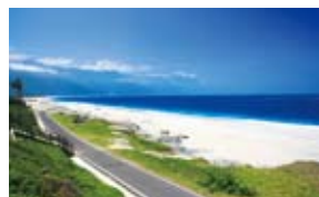
Chihshingtan Beach 七星潭