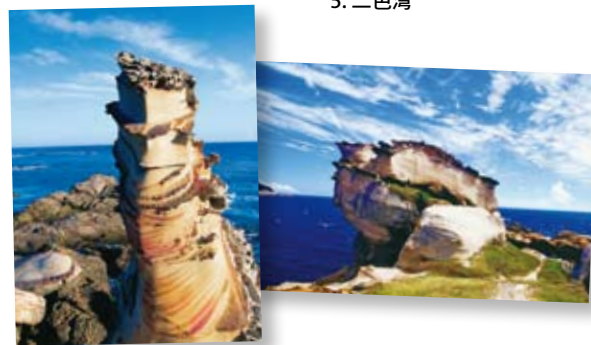
Nanya Rock Formations 南雅風化石